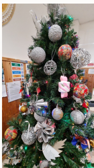
Attività "Addobbiamo l'albero"

La scuola individua percorsi specifici per gli alunni con Bisogni Educativi Speciali (BES, DSA) e diversamente abili. Promuove interventi educativi individualizzati, realizza laboratori ed attività per valorizzare l'individualità e la diversità di ciascun allievo.